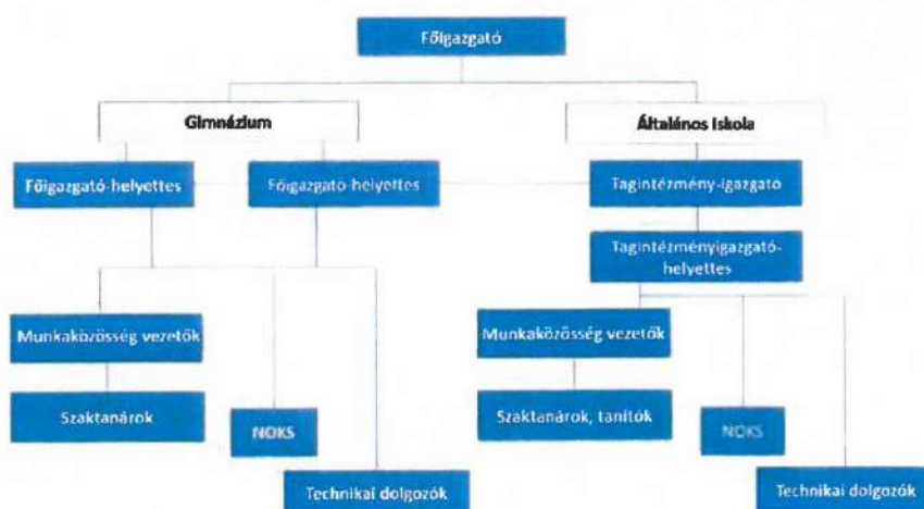
ábra: Szervezeti struktúra

Az Atilla Király Gimnázium és Általános iskola egy összetett intézmény, célom hogy a gimnázium és az általános iskola autonómiájának megőrzésével, működésünk egységes alapelvekre épüljön, a mindenkori törvények és jogszabályok betartásával. A jó munkaköri légkör biztosításához szükséges a konfliktuskezelés, a pozitív megerősítés és az esetleges hibák korrekt feltárása. Fontos, hogy mindenki tisztába legyen a feladatával, ezért nagy jelentőséggel bírnak a pontosan meghatározott jogkörök, hatáskörök és az, hogy az adott feladat milyen felelősséggel jár. Jól működő testület alapfeltétele, hogy a pedagógus munkáját elismerjék, lássa annak eredményét, kapjon arról szakmai visszajelzést, és az, hogy képesek legyenek egymás motivációjára.